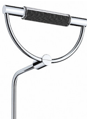
cromo lucido cod 509