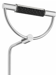
cromo satinato cod 1509