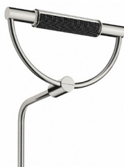
nichel satinato cod 511