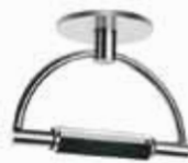
Nichel satinato retinato cod 520