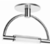
Cromo satinato opalescente cod 1529