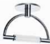
Cromo lucido tuttopalescente cod 583