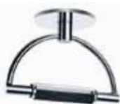
Cromo lucido retinato cod 518