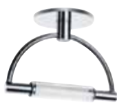
Cromo lucido opalescente cod 529