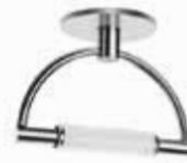
Nichel satinato tuttopalescente cod 585