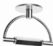
Cromo satinato retinato cod 1518