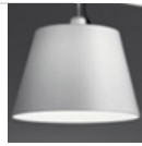
TOLOMEO MEGA DIFF.RASO 360 0781020A