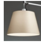
TOLOMEO SOSP/PTE DIFF.PERGAMENA D.240 0372050A