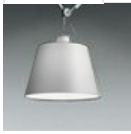
TOLOMEO SOSP/PTE DIFFUSORE RASO D.240 0781050A