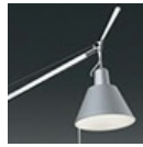
TOLOMEO SOSP.DEC.SOLO DIFF.METALLO 0371050A