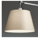
TOLOMEO MEGA DIFF.PERG.360 0780020A