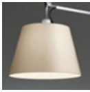
TOLOMEO MEGA DIFF.PERG.320 0780010A