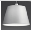
TOLOMEO MEGA DIFF.RASO 320 0781010A