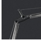
TOLOMEO TERRA SNODO A014000