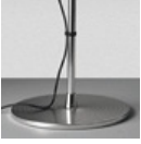
TOLOMEO TERRA BASE + ASTA A012820