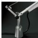
TOLOMEO SUPP.TAVOLO FISSO A004200