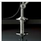
TOLOMEO MORSETTO A004100