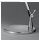
TOLOMEO BASE D 200 ALL A008600