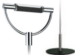
Cromo satinato base nera cod 1501 peso 5,0 kg