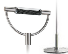
Nichel satinato base nichel satinato cod 591 peso 6,1 kg