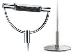
Cromo satinato base cromo cod 1504 peso 6,1 kg