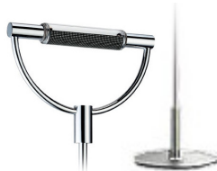
Cromo lucido base cromo cod 504 peso 6,1 kg