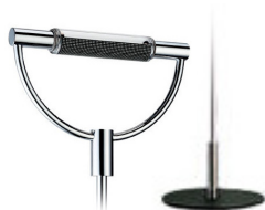
Cromo lucido base nera cod 501 peso 5,0 kg