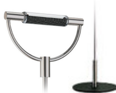
Nichel satinato base nera cod 503 peso 5,0 kg