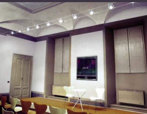
Gruppo Manerbiesi, Manerbio, Italia