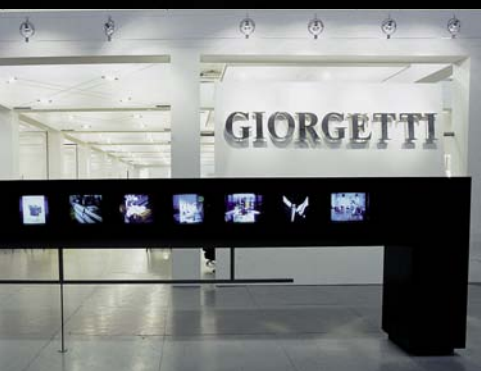
Giorgetti, Milano, Italia