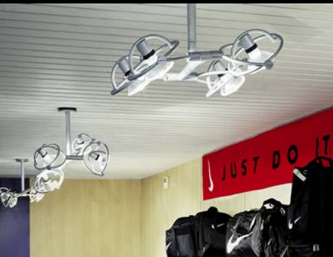
Nike, Vigevano, Italia