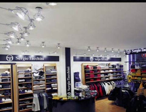
Sergio Tacchini, Milano, Italia