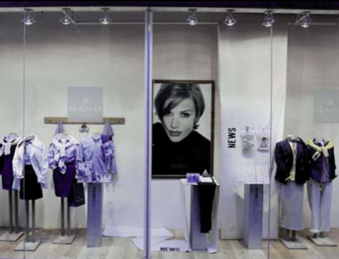
Sand, Amsterdam, Olanda