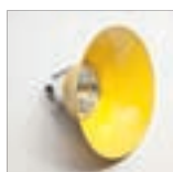
Anello comprensivo di ottica